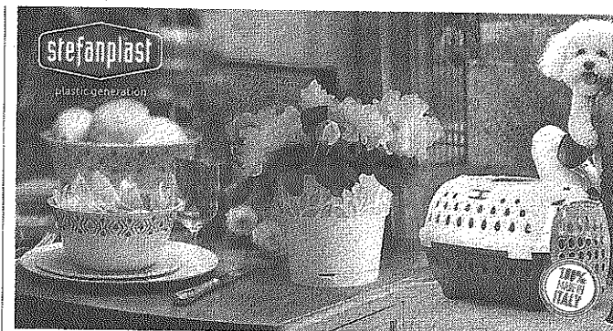
Home, Garden, Pet collections